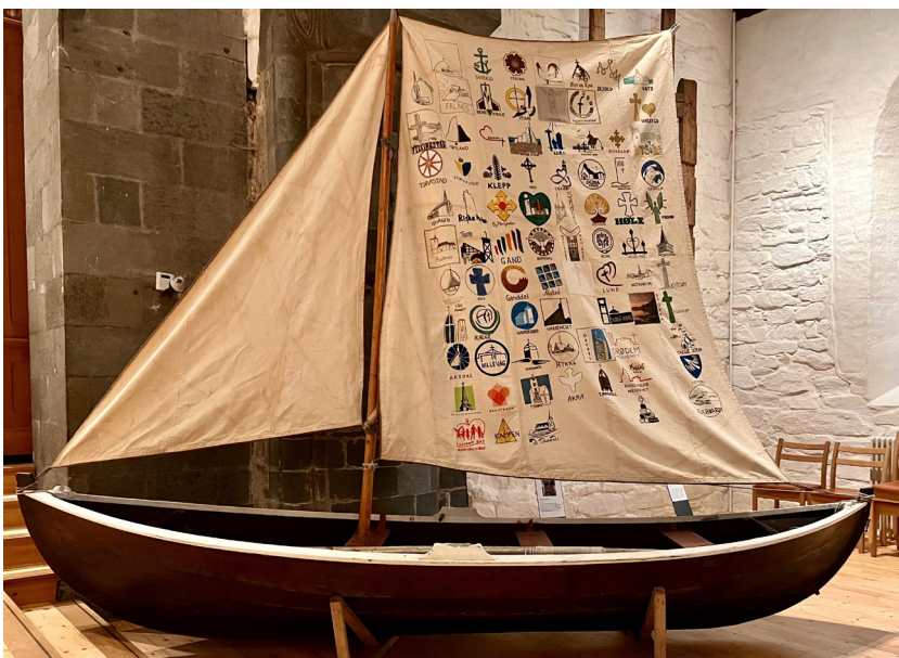
Jubileumsbåten har reist rundt i bispedømmet siden 2023 og har fått seilet fullt av logoer fra menighetene den har besøkt.

– Målet er å utvide vårt kjennskap til lokalmiljøet og senke terskelen for å snakke med kjente og ukjente i nabolaget. Alle trenger vi å bli sett og bli invitert inn i fellesskap, og alle kan vi også være med å invitere inn. Kanskje akkurat du har lyst å arrangere gjestebud? utfordrer prosjektlederen.