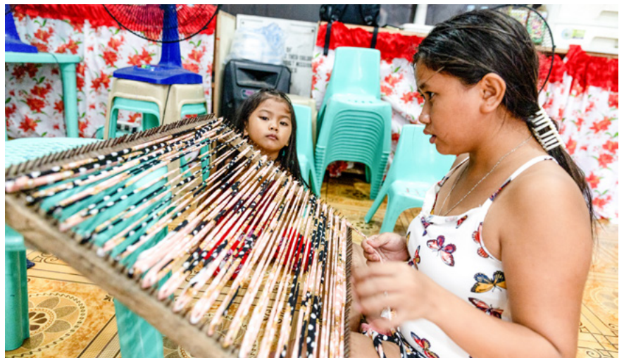
Lager tepper: Inne på det som til vanlig er skolen Misjonsalliansen driver på kirkegården, møtes flere damer for å lage tepper. Slike tepper er vanlige i alle hus på Filippinene. Ved hjelp av stoffrester lager damene fine og slitesterke tepper som de kan selge. Den ekstra inntekten kommer godt med, men det er tidkrevende arbeid.