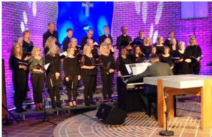
Lura kirkekor viste seg fra sin beste side